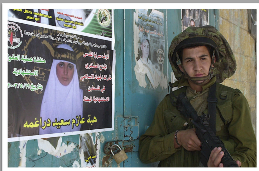
Slika 5: Propagandni poster »Glorifying Suicide Bomber« in vojak

Po ocenah angleškega časopisa Telegraph je v času odo marca 2016 več kot 6000 posameznikov iz evropskih držav (predvsem Velike Britanije, Nemčije in Francije) potovalo v Sirijo in Irak, od tega približno 550 žensk in deklet, z namenom da se pridruži skupini Islamska država, poroča Reuters Institute.