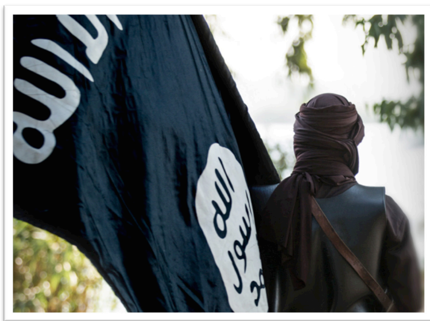
Slika 3: vir Islamic State Propaganda

početju ogromno časa, v katerem skušajo v svoje mreže zaplesti posameznike s konstantnimi stiki ter počasnim, a vztrajnim prepričevanjem o svojih teoloških konceptih, na katerih temelji Islamska država. Rekrutirajoči pogosto uporabljajo tehnike novačenja, ki se omenjajo v priročniku, izdanem s strani Islamske države, ki se imenuje »Tečaj v umetnosti rekrutiranja«. Ta sestavek podaja navodila o načinu, s katerim naj rekrutirajoči delijo »veselje in žalost« s tarčnim osebkom, s ciljem, da ga psihološko še bolj priklene in naredi odvisnega od džihadističnega gibanja, brez same eksplicitne omembe le-tega. Cilj je vzpostavitev razmerja, v katerem žrtev dobi občutek, da je našla novega prijatelja, s katerim lahko deli svoja prepričanja. Skupine so v ta namen ustanovile svoje medijske hiše, ki skrbijo za produkcijo propagandnih sporočil, na internetu gradijo skupino kot blagovno znamko, ki je privlačna za mlade, s katerimi komunicirajo prek družbenih omrežij.