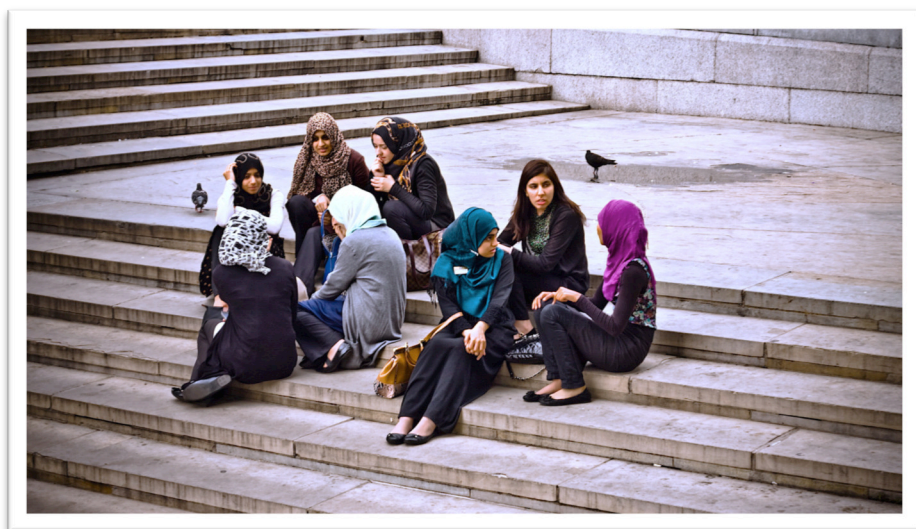
Slika 4: »Young Muslim Women«, Trafalgar square, London

V skrajnih skupinah mnogi potencialni teroristi najdejo ne samo občutek smisla, ampak tudi občutek pripadnosti in povezanosti. Luckabaugh ugotavlja, da je "velika potreba po pripadnosti dejanski vzrok ali psihološka motivacija za vstop v