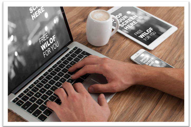
Slika 2:

Skoraj vse džihadistične organizacije, tiste od vzhodne Afrike pa do jugovzhodne Azije, danes uporabljajo internet za širjenje svojih idej. Al Kaidina spletna stran Azzam.com izpred dvajsetih let