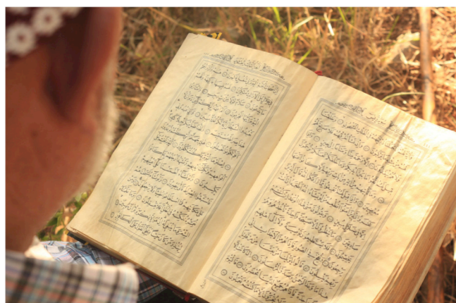
Slika 1: Koran